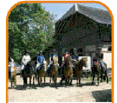
un gérant d'un gîte d'étape équestre