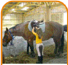
un centre équestre