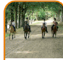
un particulier qui a un équidé chez soi pour le loisir