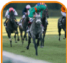
un entraîneur de chevaux de course

L'enregistrement sera effectué par l'intermédiaire de France galop ou de la SECF.