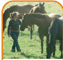
un éleveur qui a des juments