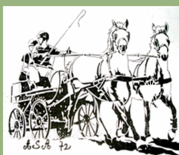
Association Sarthoise d'Attelage

http://www.ffe.com/tourisme/Evenements/Journee-Nationale-de-l-Attelage-de-Loisir